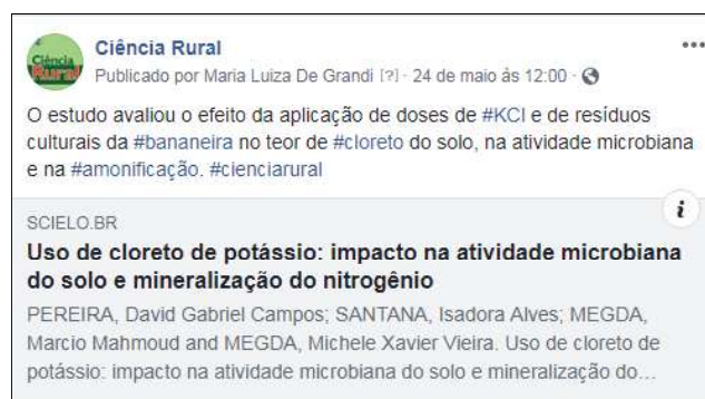
Figura 3 - Postagens com hashtags e links de acesso ao artigo

As hashtags consistem em um recurso tecnodiscursivo próprio do Facebook e Twitter que possibilita o rastreamento do conteúdo nestas redes. Seu uso permite conectar e vincular conteúdos dispersos. A seleção das hashtags utilizadas são por relevância dentro do contexto do artigo. Procuramos inserir uma hashtag com o nome da revista para facilitar a busca pelas postagens da página da Ciência Rural no Facebook e criar uma identificação, além de hashtags com palavras-chave dos artigos divulgados que sejam buscados com frequência no Facebook (veja exemplo na figura 3)